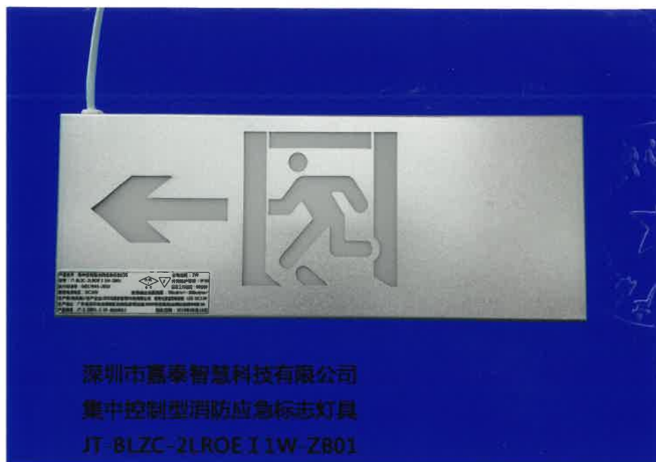
产品型号: JT-BLZC-2LR0E I 1W-ZB01 (图 B. 1+图 B. 5)