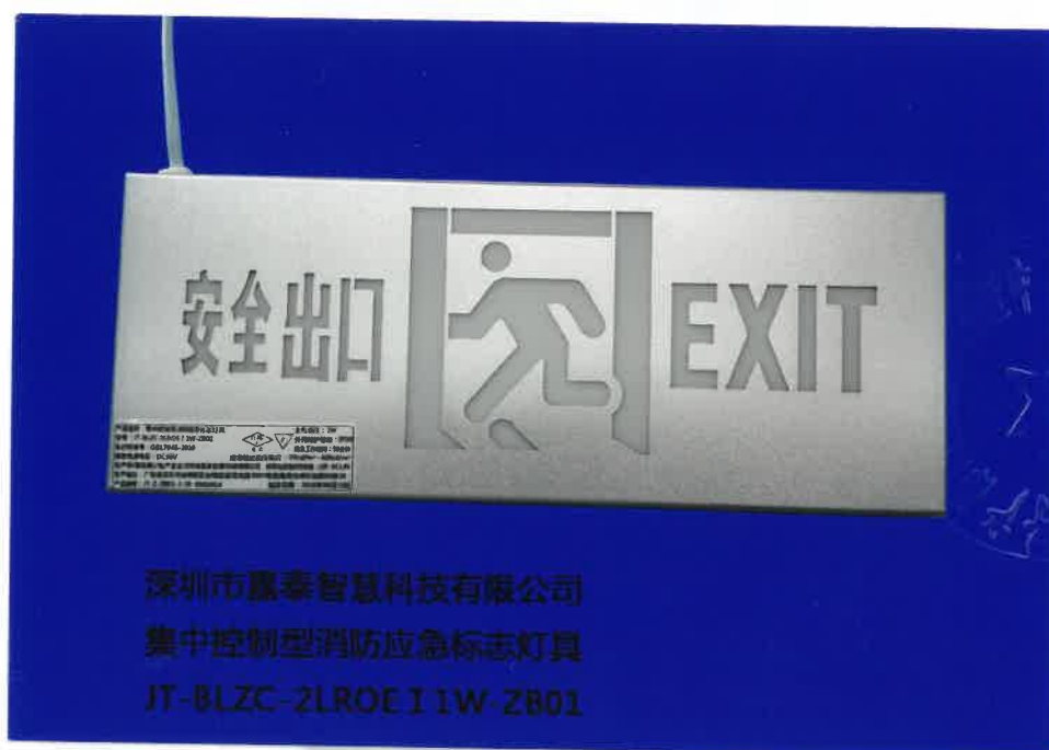
产品型号: JT-BLZC-2LR0E I 1W-ZB01 (图 B. 1)