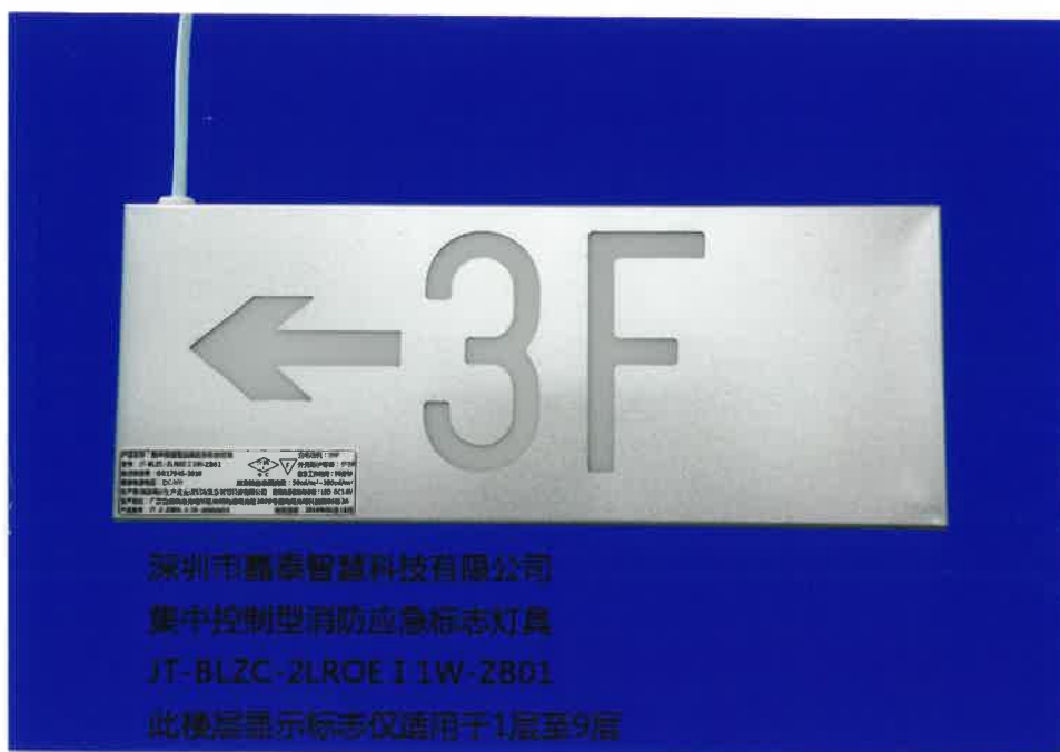
产品型号: JT-BLZC-2LR0E I 1W-ZB01 (图 B. 5+图 B. 6 3F)