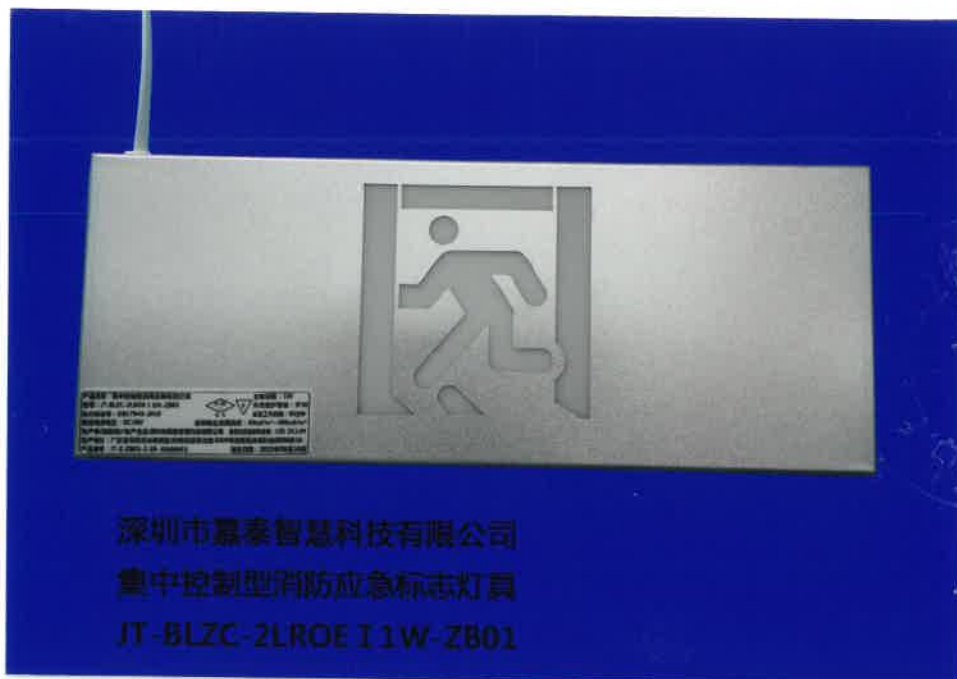
产品型号: JT-BLZC-2LR0E I 1W-ZB01 (图 B. 1)